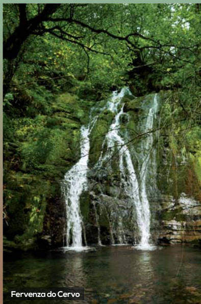
Fervenza do Cervo