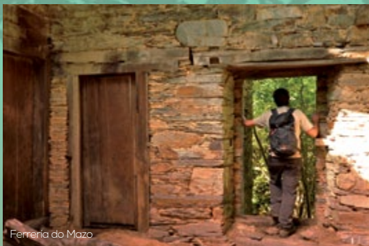
Ferrería do Mazo